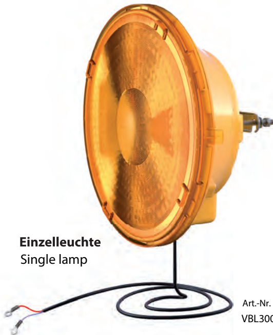
Einzelleuchte Single lamp